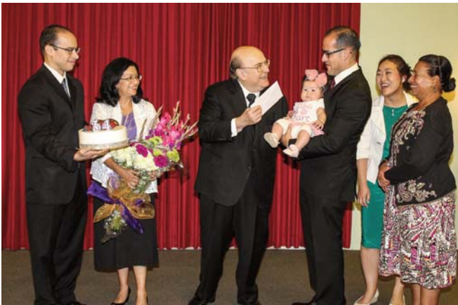
Tiến sĩ và Bà Hymers kỷ niệm 34 năm ngày cưới.