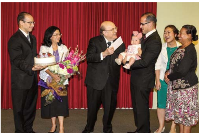
結婚三十四周年を祝うハイマーズ博士ご夫妻